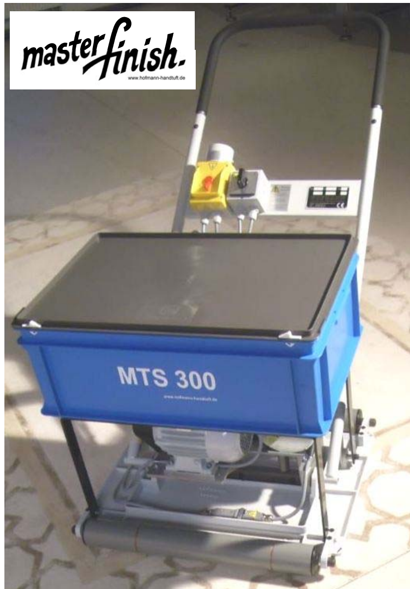
Bild zeigt MTS 300 mit angebauter Absaugung